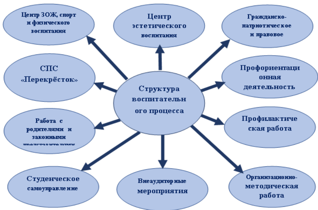
Рисунок 6.1 Организационная структура воспитательной работы