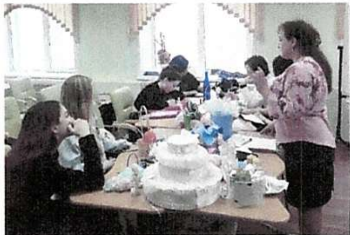
Перед Вами участники компетенции “Сервис на объектах гостеприимства”

Многие из участников первокурсники, профессиональных компетенций у них недостаточно, но они стараются, трудом и терпением постигают азы профессии.