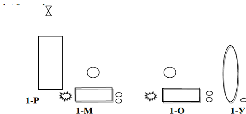
Рис. 1. План рабочего места в зоне участников