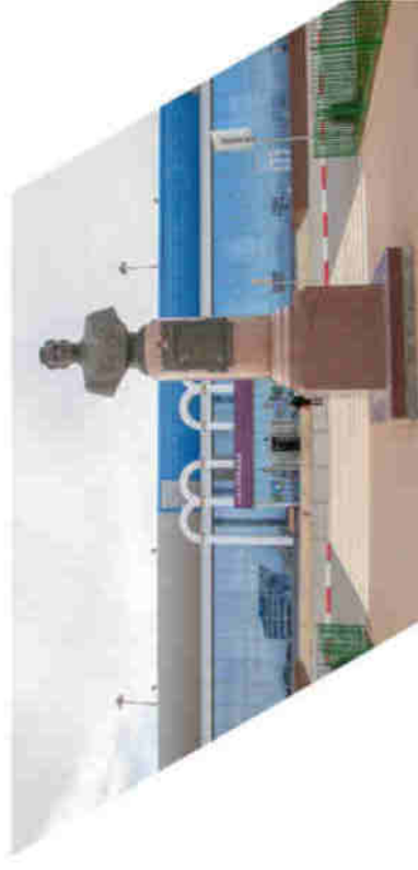
Международный аэропорт Махачкала (Уйташ) имени дважды Героя Советского Союза Амет-Хана Султана