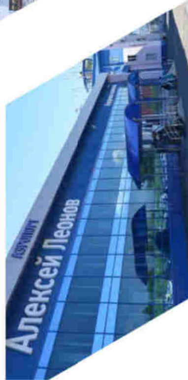
Международный Аэропорт Кемерово имени Алексея Архиповича Леонова