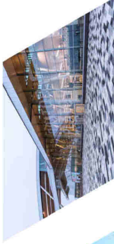
Международный аэропорт Ростова-на-Дону имени казацкого атамана Матвея Ивановича Платова